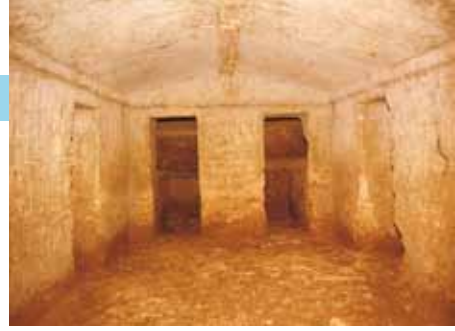
Interno di una tomba a camera di Dometaia

Orario di visita: da luglio a settembre tutti i sabati, le domeniche e i festivi dalle ore 16.30 alle 18.30; da ottobre a dicembre tutte le domeniche dalle 15.00 alle 16.30