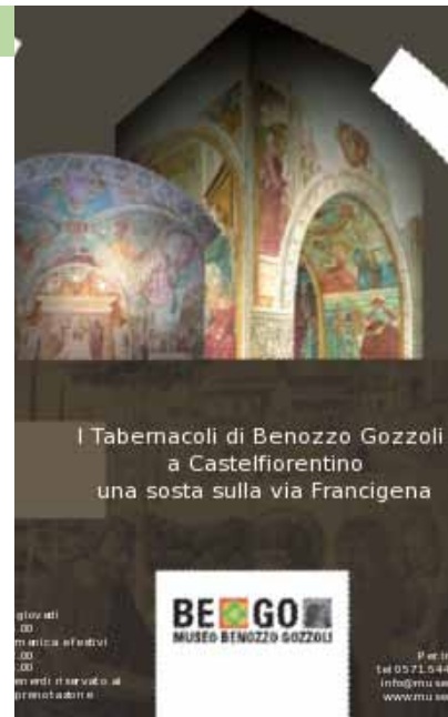
I tabernacoli di Benozzo Gozzoli

Orario di apertura: lunedì e venerdì per gruppi su prenotazione 9.00 – 13.00 o intera giornata martedì e giovedì 16.00-19.00 sabato e domenica 10.00 - 12.00 e 16.00 - 19.00 Indirizzo e-mail: info@museobenozzogozzoli.it , cultura@comune.castelfiorentino.fi.it Numero di telefono: 0571 64448 (Museo) 0571 686338 (Ufficio Cultura e biblioteca Comune)