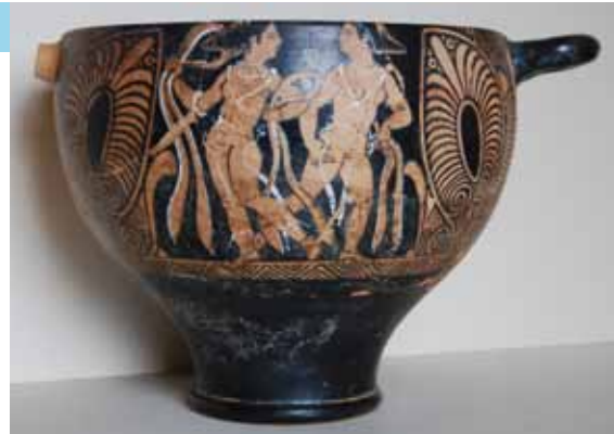
Ceramica etrusca conservata al museo

Numero telefonico: 0577 922954 - 0577 920490