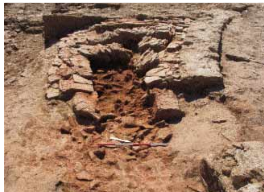
*11_13 Im Süden des Saales mit drei Apsiden gefundener Keramikofen. Zu erkennen sind die Bogenstützen des durchlocherten Bodens.

Zahlreiche Objekte aus Kupferlegierungen deuten auf die Präsenz von Kupferschmiedern hin. Nur hochspezialisierte Handwerker waren in der Lage, die in großer Zahl aus späteren Schichten geborgenen und aus dünn verarbeiteten Blechen produzierten Fundstücke herzustellen. Interessant sind zudem viele Blei-