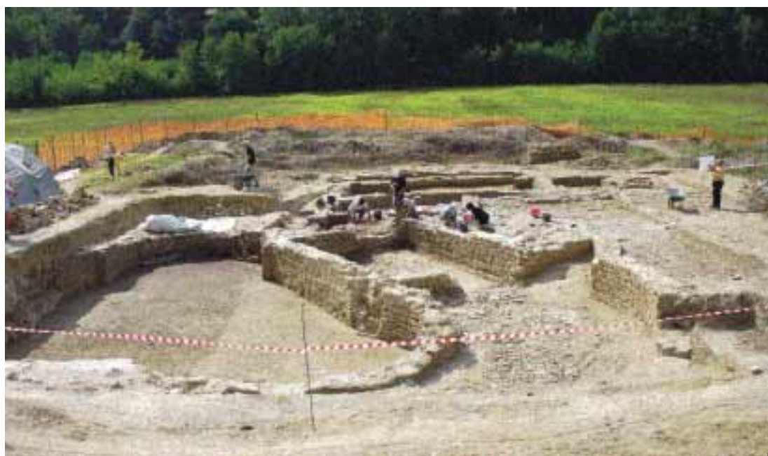
11_06 Blick auf die Ausgrabung im Jahr 2007, Aufnahme von Norden.

gestellt, dass zwischen dem 6. und 7. Jh. n. Chr. sowohl außerhalb des Apsiden-saales als auch im großen Bereich innerhalb der bogenförmigen Mauer eine Umnutzung der Villa stattfand. In deren Folge scheint die Villa ihre ursprüngliche Funktion als Wohngebäude verloren zu haben. Sie diente als Produktionsstätte, die germanische und byzantinische Merkmale aufweist.